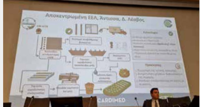
Φωτογραφία 4. Διαφάνεια από την ομιλία του κυρίου Μαλαμή