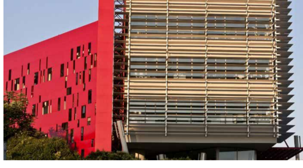
Φωτογραφία 1. Άποψη του Συνεδριακού Κέντρου του ΑΠΘ, ΚΕΔΕΑ.

Η εκδήλωση έλαβε χώρα υπό την αιγίδα του Περιφερειακού Τμήματος Κεντρικής και Δυτικής Μακεδονίας της Ένωσης Ελλήνων Χημικών.