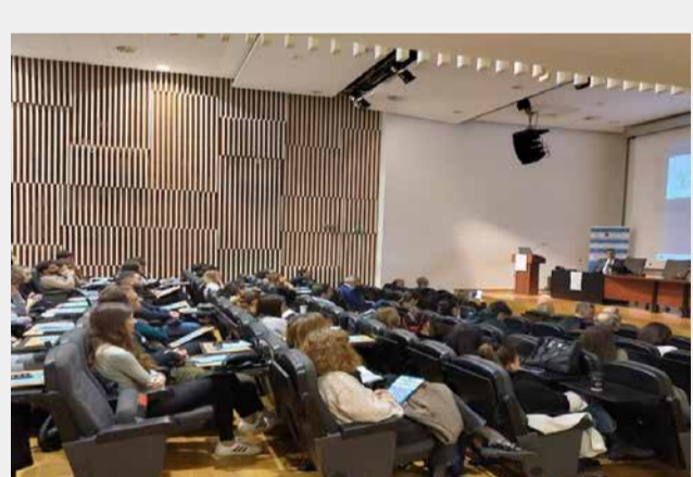
Φωτογραφία 6. Άποψη του αμφιθεάτρου Ι του ΚΕΔΕΑ κατά τη διάρκεια της ημερίδας.